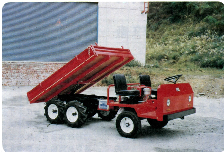
圖 1 伍氏牌 W-40 型農地搬運車