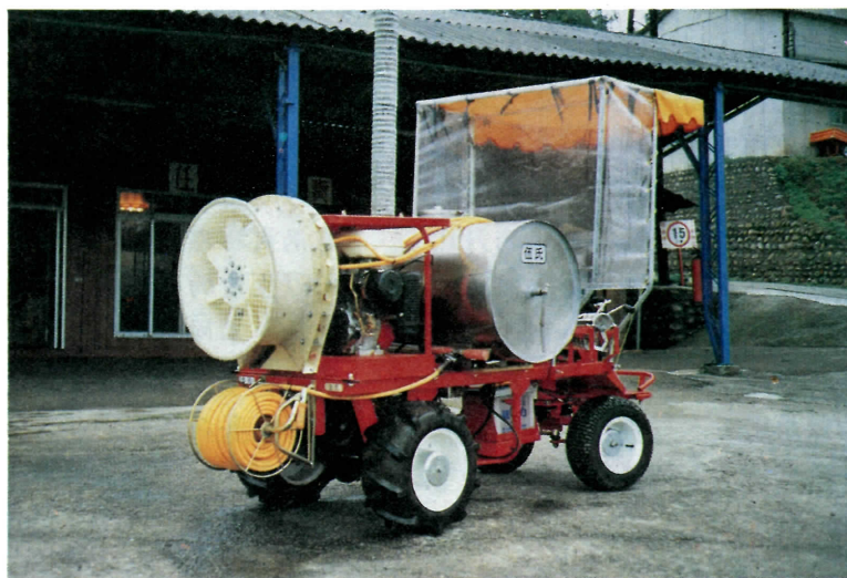
圖 2 伍氏牌 WBC-1 型噴藥車

發行人兼編輯人：吳登聰 發行所：財團法人農業機械化研究發展中心 董事長：劉頂振 主任：蕭介宗 中華民國台北市信義路 4 段 391 號 9 樓之 6 電話：(02) 7093902 ~ 3