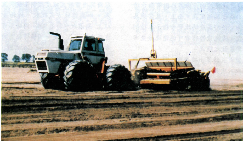
圖一 採用雷射從事耕地整平作業

雷射式坡度控制系統由發送器及接收系統組成；前者通常設定在工作區域的中央，而後者則裝置在拖曳農具上。雷射發送器以每秒鐘5轉之頻率放射出紅色之雷射光束而構成一完整的光面，各方向可達1000呎（300公尺）之範圍。此光面能夠在正確平面至10%斜度之間做調整。