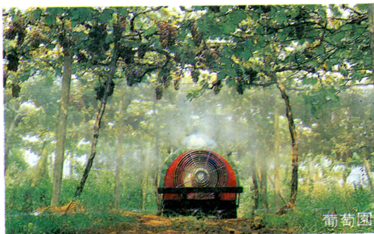
圖2 佳農牌噴霧車在果園內作業情形

發行人兼編輯人：吳登聰 發行所：財團法人農業機械化研究發展中心 董事長：劉頂振 主任：蕭介宗 中華民國台北市信義路4段391號9樓之6 電話：(02) 7093902 ~ 3