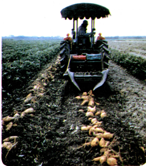
圖1 甘藷收穫機作業情形

轉的迴轉刀予以切碎，切碎的蔓藤再被⑦排蔓板推向左右兩邊而落入畦溝中。為適應不同之畦高，並避免切蔓刀打擊土壤，或切傷薯塊，刀軸之離地高度可以調整。