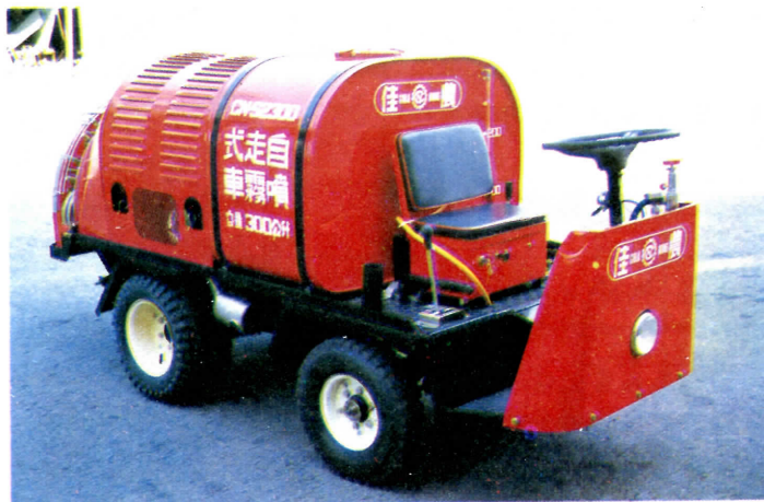
圖1 佳農牌CN-S 2300型自走式噴霧車

霧機技術，及製造農地搬運車之經驗，而開發成功自走式噴霧車。該機已獲政府核定售價為24萬元，至今已銷售百餘台。據稱，噴霧車自該公司推出以來，甚受栽種葡萄、梨子、柑橘、楊桃、蓮霧等果農好評，前景看好！